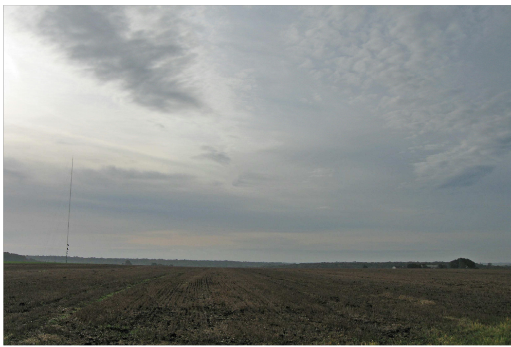
Eolienne n° 2 : Vue avant implantation