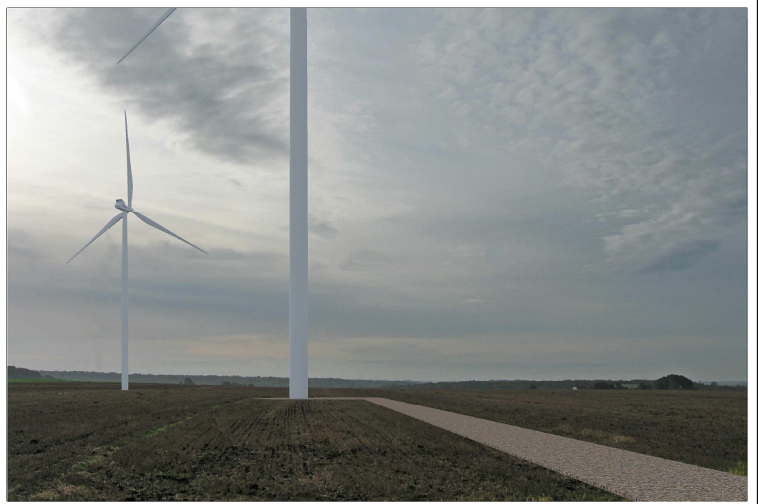
Eolienne n° 2 : Vue après implantation